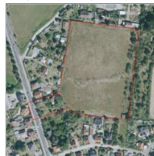
Geltungsbereich vorhabenbezogener Bebauungsplan „Wohngebiet Südhöhe Bautzen – Oberkaina“

In der Sitzung am 30.3.2022 hat der Stadtrat den Entwurf des vorhabenbezogenen Bebauungsplanes „Wohngebiet Südhöhe Bautzen – Oberkaina“ in der Fassung vom 10.2.2022 zur Auslegung bestimmt. Das Plangebiet befindet sich östlich der Neusalzaer Straße zwischen Siedlerweg und Pappelweg. Planungsziel ist die Errichtung von Wohngebäuden.